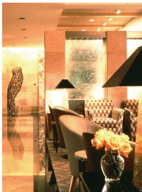
Una terminal de primera categoría para los viajeros modernos.