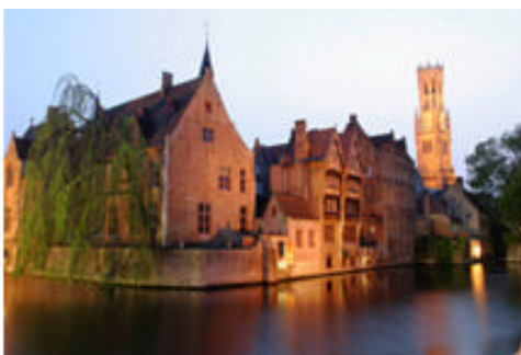
Brujas